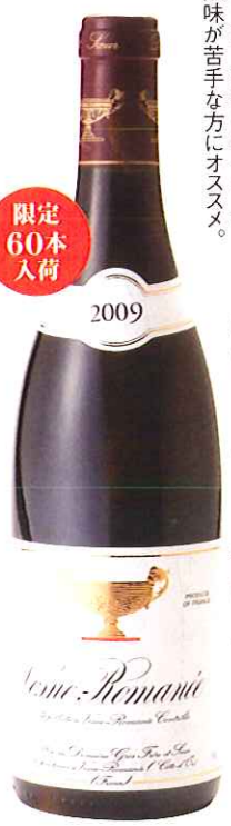
容量 750ml 価格 4,980円 商品番号 415017 ※少量入荷の為お取り寄せ商品になります。

ヴォーヌ・ロマネ09「グロ・フレール&スール」 香り高く酸味は穏やか。ポーリウム感がありたっぷりとした果実味が魅力。酸味が苦手な方にオススメ。