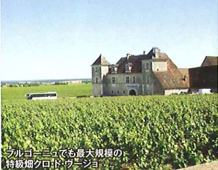
ブルゴーニュでも最大規模の特級畑クロド・ヴージョ

レストランで軽いランチをとることにした。このレストランではブレの自慢のワインを何種類も試飲しながら食事ができる。料理とワインとの相性は素晴らしく、チーズのフライやこの地方の名物「パセリハム」を口にする、知らず知らずのうちにワインがすすむこととすすむこと。