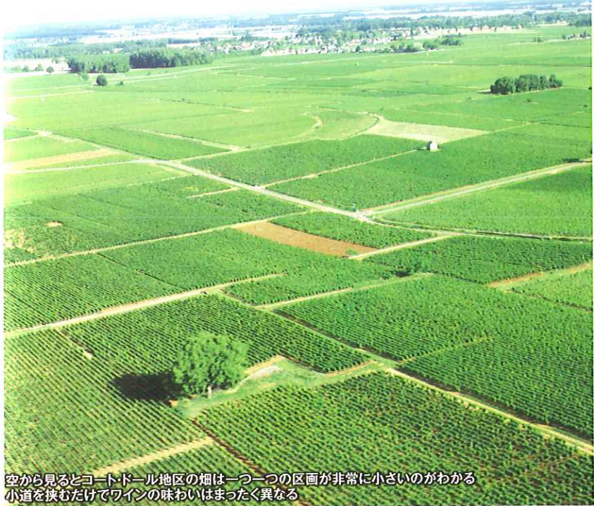
空から見るとコート・ドール地区の畑は一つ一つの区画が非常に小さいのがわかる 小道を狭むだけでワインの味わいはまったく異なる