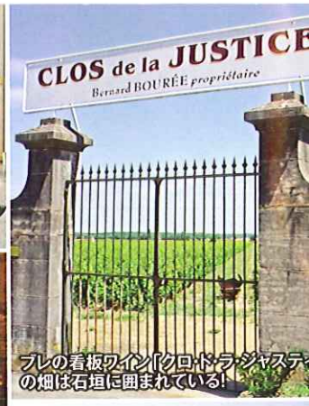
ブレの看板ワイン「クロド・ラ・ジャスティ」の畑は石垣に囲まれている!