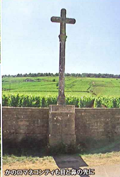
かのロマネコンティエも目と鼻の先に