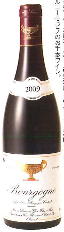
容量 750ml 価格 2,680円 商品番号 419337

ブルゴーニュ・ルージュ09「グロ・フレール&スール」 いきいきとした酸味と柔らかい果実味とのバランスが素晴らしいブルゴーニュのお手本ワイン。