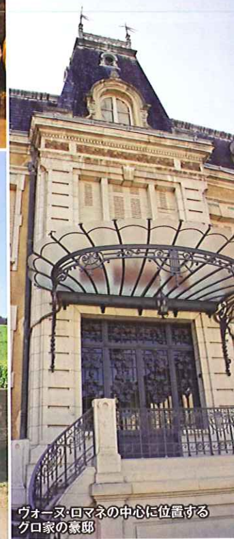
ヴォーヌ・ロマネの中心に位置するグロ家の豪邸