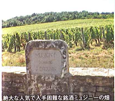
絶大な人気で入手困難な銘酒ミュージニーの畑